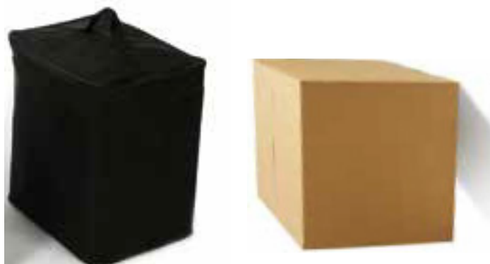
SACCA IN TELA MORBIDA + SCATOLA IN CARTONE